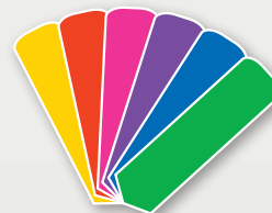
Standardfarben / Standard colours

Diese Farben sind für alle Modelle erhältlich These colours are available with all models.